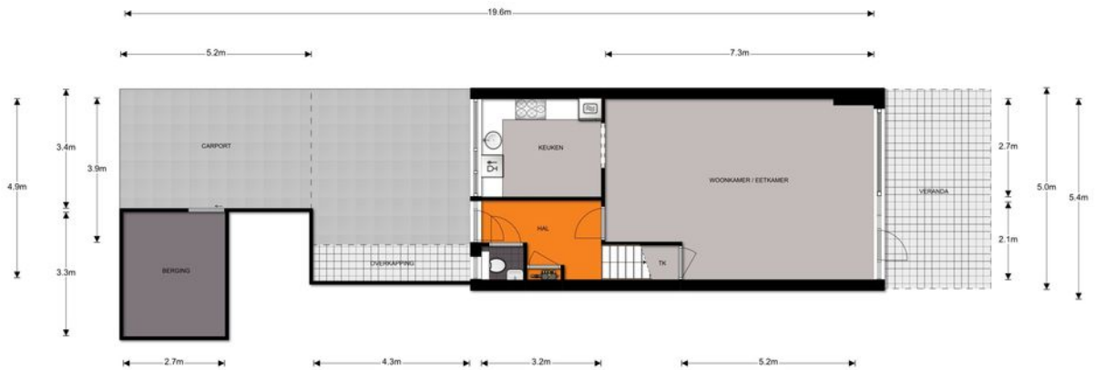
Begane grond, Neerijnen 44 te Barneveld De plattegronden zijn ter indicatie en geproduceerd voor promotionele doeleinden. Aan de plattegronden kunnen geen rechten worden ontleend. © topr.nl