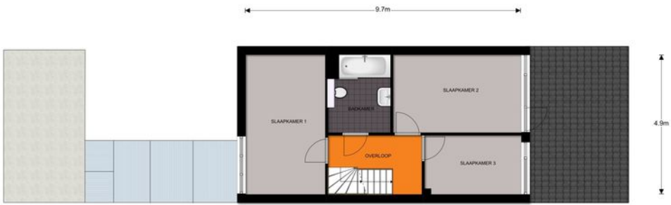
1e Verdieping, Neerijnen 44 te Barneveld De plattegronden zijn ter indicatie en geproduceerd voor promotionele doeleinden. Aan de plattegronden kunnen geen rechten worden ontleend. © topr.nl